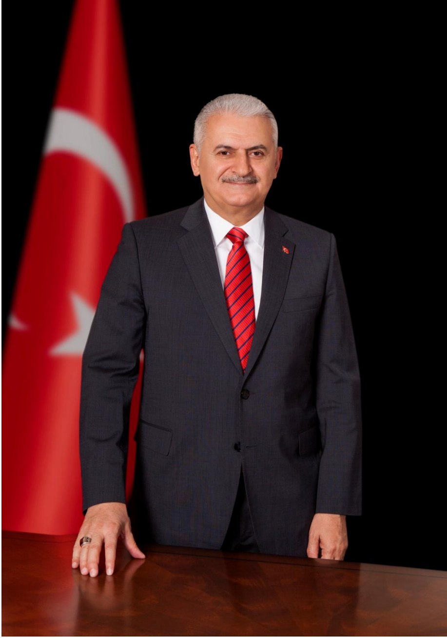
Binali YILDIRIM Başbakan